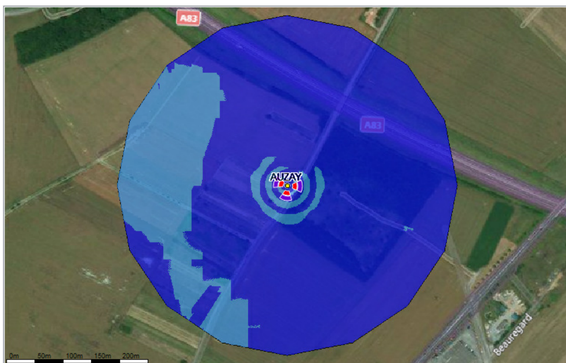
Fond de carte (photo aérienne). Logiciel de simulation Cellerity, éditeur Orange Labs

À 1,5 m du sol, le niveau maximal simulé en intérieur pour les antennes à faisceau fixe est compris entre 1 et 2 V/m.