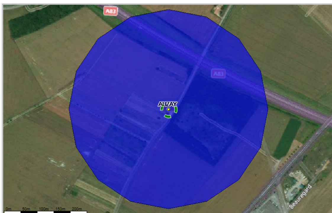
Fond de carte (photo aérienne), source : bing. Logiciel de simulation Cellerity, éditeur Orange Labs

À 1,5 m du sol, le niveau maximal simulé en intérieur pour les antennes à faisceaux orientables est compris entre 0 et 1 V/m.