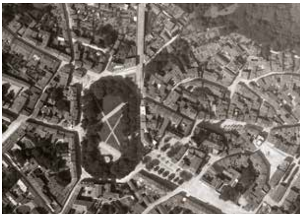
Place Viète en 1926

raisons de sécurité. La circulation des véhicules contournant la Place se fait ensuite en sens unique et la vitesse est limitée. Aujourd'hui accessible à tous, elle offre une panoplie d'usages, allant du stationnement au rassemblement en passant par le simple plaisir de la fouler.