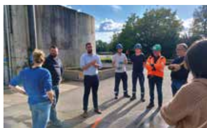
Les correspondants de quartier, élus et agents ont été informés et sensibilisés au sujet du traitement de leurs eaux usées