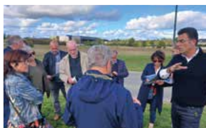
Les travaux du futur crématorium démarreront en février 2025 pour une ouverture en septembre de la même année

Le rendez-vous du jeudi 10 octobre était l'occasion de faire le point sur la reprise de l'enrobé et le traitement des racines du parvis de l'église. Au cimetière Saint-Médard, engazonnement, plantations d'arbres et de buissons ont été présentés. Une présentation du futur crématorium s'est ensuite tenue boulevard des Champs Marot. Après passage dans la rue de la Roche de Boisse pour examen de sa réhabilitation, la déambulation s'est terminée avec la visite du lotissement rue Villa Gallo-Romaine.