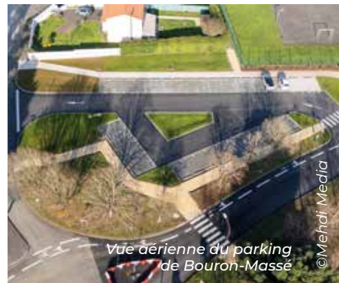
Vue aérienne du parking de Bouron-Massé

En octobre dernier, le parking de l'école Bouron Massé était à nouveau mis à disposition des parents d'élèves et usagers. Le coût d'aménagement pour les lots VRD et espaces verts, pour le parking et le parvis de l'école s'élevaient à 332 000 € HT pour un montant global de 1,9 M€ sur le quartier. Ces aménagements sont co-financés par l'État via l'ANRU, l'agence de l'eau et le fonds vert.