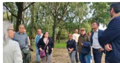
La remise en état des passerelles, des escaliers et le renouvellement des arbres viendront égayer le site de la Fontaine de Charzais