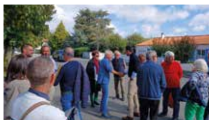
Rue Grissais, nouveaux arbres et places de stationnements sont au cœur des dialogues.

La déambulation a démarré rue Grissais où les racines des arbres seront traitées, de nouveaux arbres plantés et les places de stationnement revues. Présence de mobilités douces et végétalisation de la rue Rabelais, remise en état des espaces de stationnements de la rue George Sand et travaux de voirie de la rue du Canon d'Or ont ensuite été discutés. Un point sur le projet de chicanes et de zones de stationnements s'est tenu dans la rue Octave de Rochebrune avant la visite de l'usine de traitement des eaux usées.