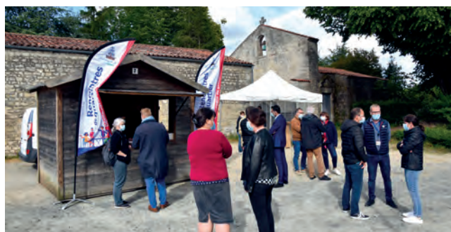
Retour des échanges en direct et en plein air comme l'an passé (ici le quartier Porteau Saint-Thomas en mai 2021).

democratie.proximite@ville-fontenaylecomte.fr