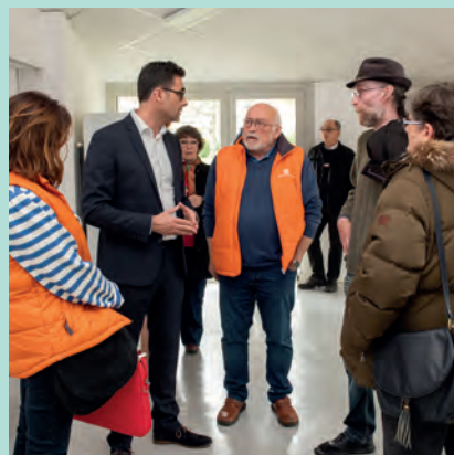
Visite des locaux de l'Espace solidarité Joséphine-Baker, en compagnie des associations concernées lors de l'inauguration, le 12 avril.