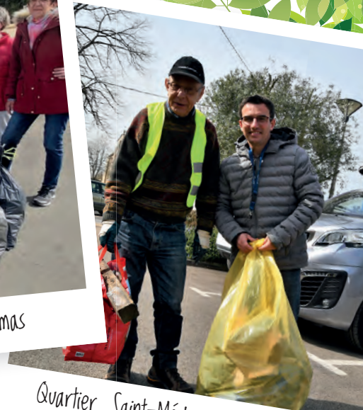
Quartier Saint-Médard Boisse Birossais