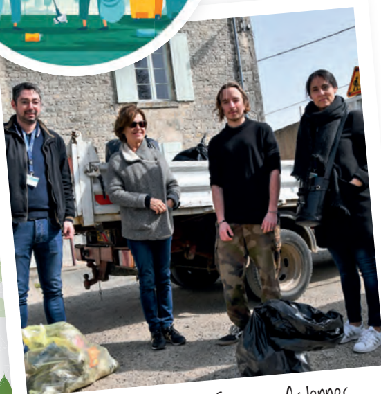
Quartier Charzais Granges Ardennes

Un peu plus d'une centaine de personnes a participé à cette matinée dans les différents quartiers de notre ville sans oublier les élèves des écoles qui eux avaient participé dans la semaine. Sept points de collecte, un par quartier, ont permis aux participants de déposer les déchets ramassés et triés. Un beau travail collectif pour redonner de l'éclat à la Ville et lutter contre le fléau de ces déchets sauvages qui polluent notre environnement et notre cadre de vie.