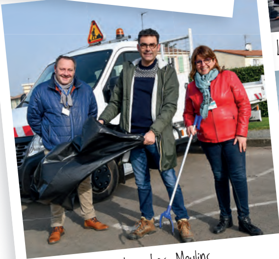
Quartier Les Moulins