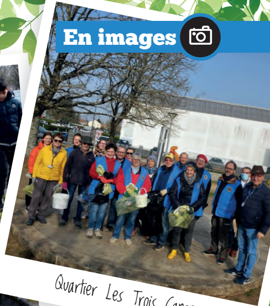
Quartier Les Trois Canons