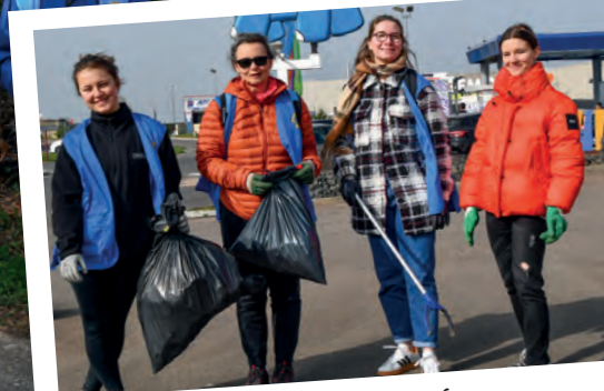
Quartier Les Trois Canons