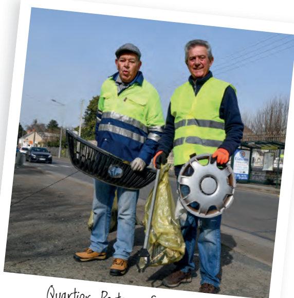
Quartier Porteau Saint-Thomas