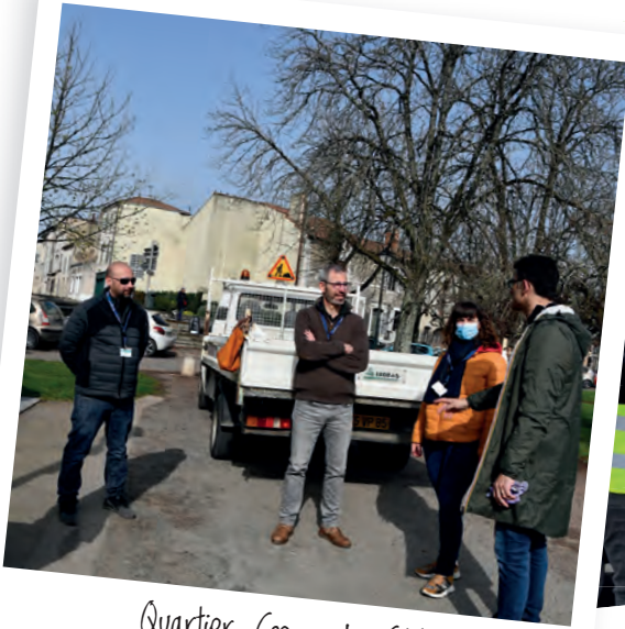
Quartier Cœur de Cité