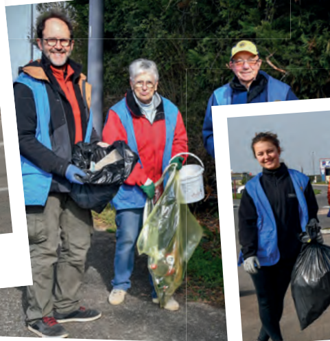
Quartier Les Trois Canons