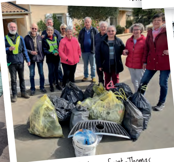
Quartier Porteau Saint-Thomas