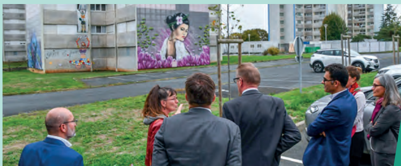
▲ Après la signature, une déambulation dans le quartier a permis de découvrir les fresques réalisées par ArMuLETe, Arts Multiples En Territoire sur les tours des Moulins.